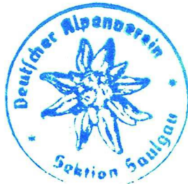
Hans-Peter Hauser Erster Vorsitzender

Genehmigung durch den DAV gemäß §§ 7 Abs. 1 g), 13 Abs. 2 h) der DAV-Satzung: